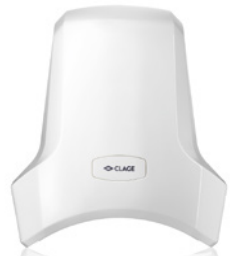
Der hygienische und umwelt- schonende Händetrockner WHT